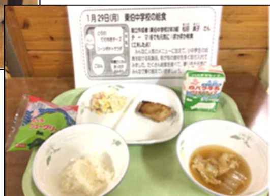
生徒の考えたメニューと、 考える時の工夫した点の紹介